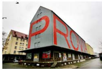
Investor holt Proviantamt aus Dornröschenschlaf